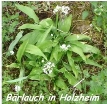
Bärlauch in Holzheim