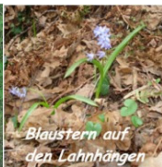
Blaustern auf den Lahnhängen