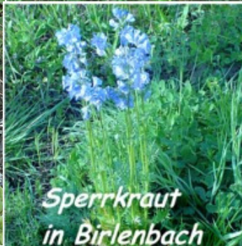
Sperrkraut in Birlenbach